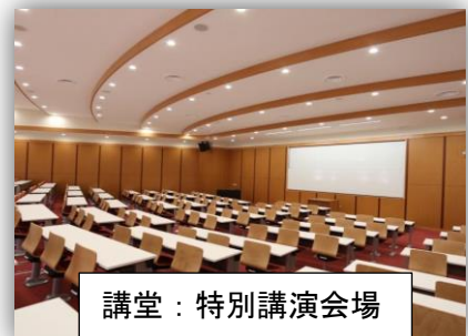
講堂：特別講演会場