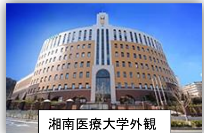
湘南医療大学外観